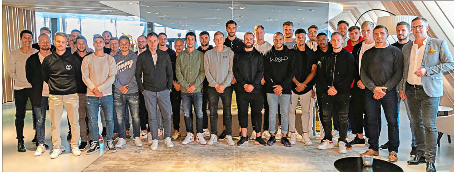
Das etwas andere Mannschaftsfoto: Der SSV Jahn Regensburg im Restaurant Johannis im Modehaus Garhammer. Noch ohne die Anzüge, denn die werden den Spielern noch auf den Leib geschneidert.

Im dritten Stock waren ein Warteraum und eine Umkleidevorbereitung. In Fünfergruppen durften die Kicker dann nacheinander ihre neuen Anzüge probieren und Änderungswünsche