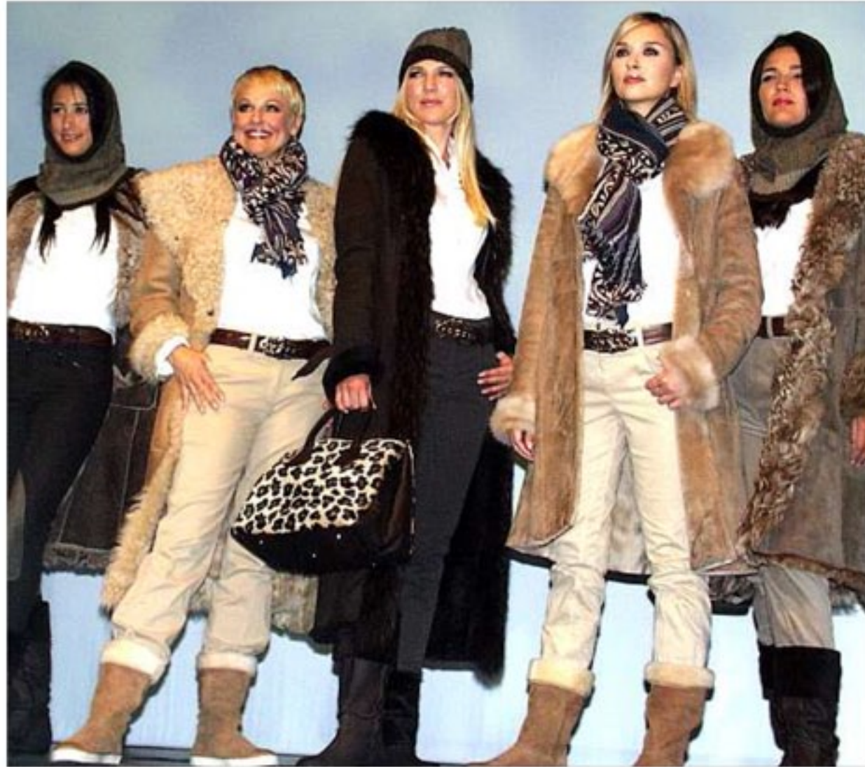
Beige, grau, braun in allen Nuancen und vor allem warm – so kommt Frau gut durch den Mode-Winter 2010/2011.