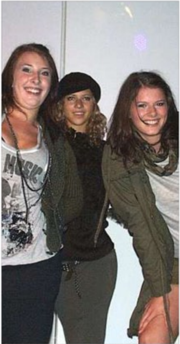
Ganz schön kess: Die Tänzerinnen von Dancevolution machten eine gute Figur.