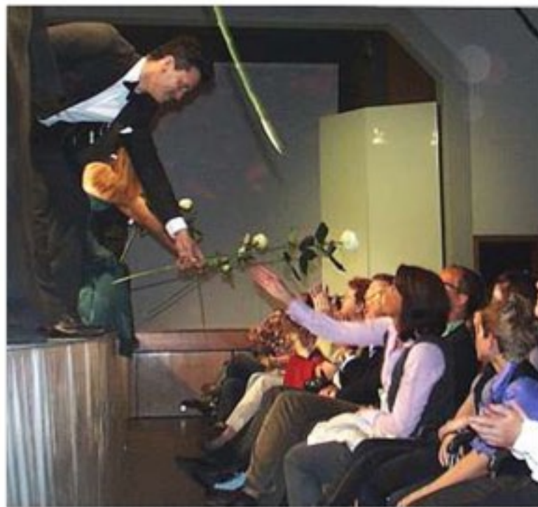
Zum Abschluss gab's weiße Rosen für Damen im begeisterten Publikum.