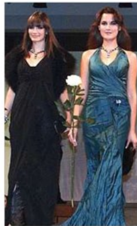
Elegante Abendgarderobe – der nächste Ball kommt bestimmt.