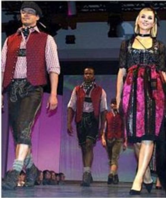
Tracht gehört einfach dazu: Die Buam und Madl konnten sich gut sehen lassen in der Krachledernen und dem Dirndl.

Modehaus Garhammer zeigt neue Kollektionen – Alle vier Veranstaltungen innerhalb von zwei Tagen ausverkauft