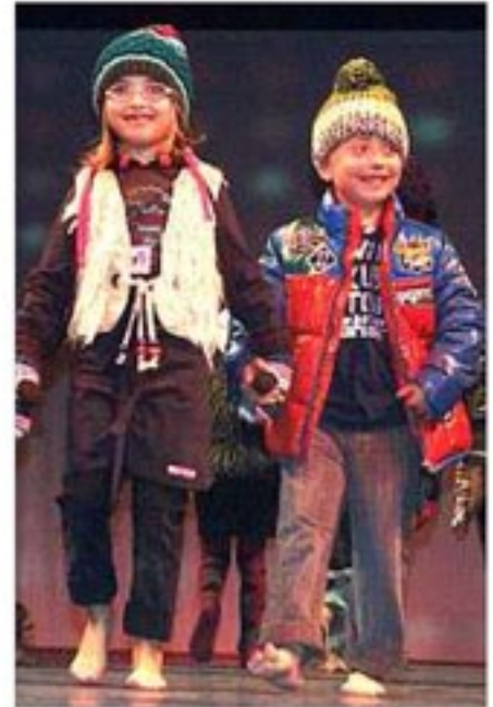
Sichtlich gefallen hat es auf dem Laufsteg auch diesen beiden „TSV-Eiskristallen“.