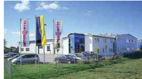
Das Intercontec-Stammhaus Niederwinkling (Lkr. Straubing-Bogen)

Die im Jahr 1996 von Wolfgang Pfeiffer gegründete Intercontec GmbH hat sich seither nach eigenen Angaben zum Marktführer bei industriellen Rundsteckern entwickelt. Seit 2001 ist die Firma in einem Neubau im Gewerbegebiet in Niederwinkling (Lkr. Straubing-Bogen) untergebracht; im Jahr 2003 mussten bereits aufgrund der großen Nachfrage die Räumlichkeiten erweitert und die Kapazitäten mehr als verdoppelt werden. Heute sind in der Intercontec Firmengruppe, bestehend aus dem Stammhaus in Niederwinkling, einer Niederlassung in Toronto/Kanada und der Motec Montage-technik Künzelsau, insgesamt 85 Mitarbeiter beschäftigt.