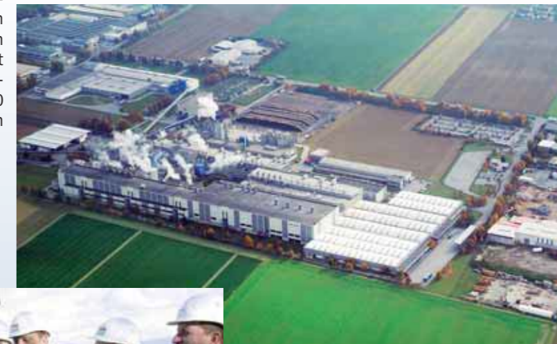
Zwischen dem bisherigen Werk und der Autobahn A 92 wird das neue Werk errichtet

Offsetpapier wird dadurch um dieselbe Menge ungestrichener SC-Papiere an der dritten Anlage erhöht.